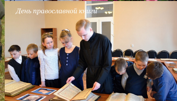
День православной книги