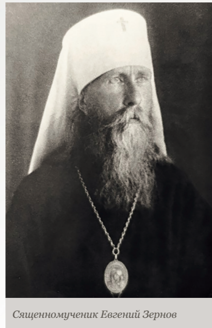
Священномученик Евгений Зернов

Расстрелянный в 1918 году Балахнинский епископ Лаврентий (Князев) последние свои проповеди перед арестом