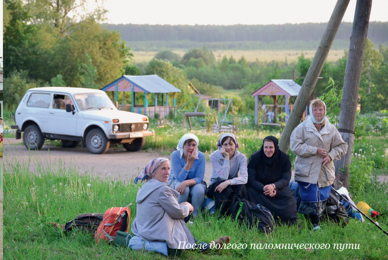
После долгого паломнического пути