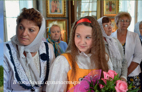
В ожидании архипастыря