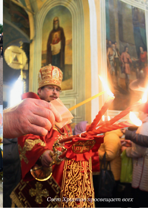
Свет Христов просвещает всех