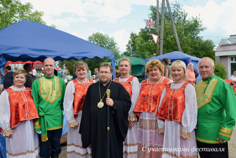
С участниками фестиваля