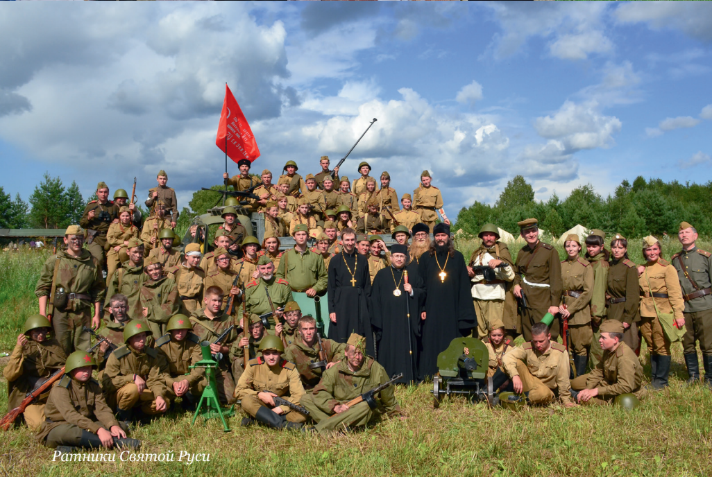
Ратники Святой Руси