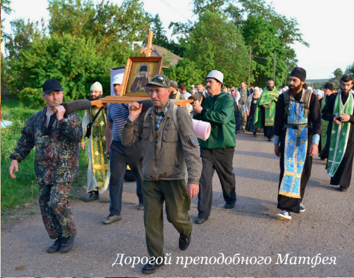
Дорогой преподобного Матфея