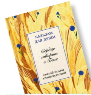
Святой Иоанн Кронштадтский БАЛЬЗАМ ДЛЯ ДУШИ СЕРДЦЕ ГОВОРИТ О БОГЕ

Святой праведный Иоанн Кронштадтский (1829-1908) – один из самых почитаемых русских святых, чудотворец «молитвенник земли Русской», хотя, на первый взгляд, его жизнь не соответствовала привычному образу молитвенника: монаха-пустынника. Отец Иоанн нес служение в самой суете мира, в Кронштадте, городе, который был местом административной высылки асоциальных личностей, многочисленных нищих и чернорабочих. Всегда среди народа, он не совершал каких-то сверхъестественных подвигов, напротив, злые языки обвиняли отца Иоанна в роскоши из-за хорошей кареты и дорогой одежды, с которой, впрочем, он легко расставался, раздавая нуждающимся.